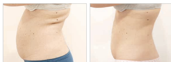
Trattamento delle lassità cutanee